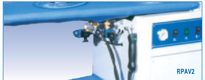
Tabla de planchar universal con vapor y aspiradora.

Superficie de planchado calentada por vapor.